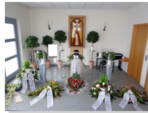
Beispiele von Aufbahrungsdekorationen in unserem klimatisierten Bestattungshaus.

Telefon: (05224) 28 32 oder (05225) 87 29 32